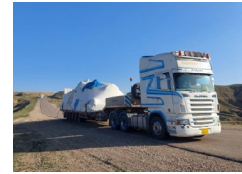
Irak'ın kuzeyinde aktarma