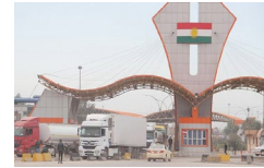
İbrahim Halil sınırı (Türkiye-İrak)